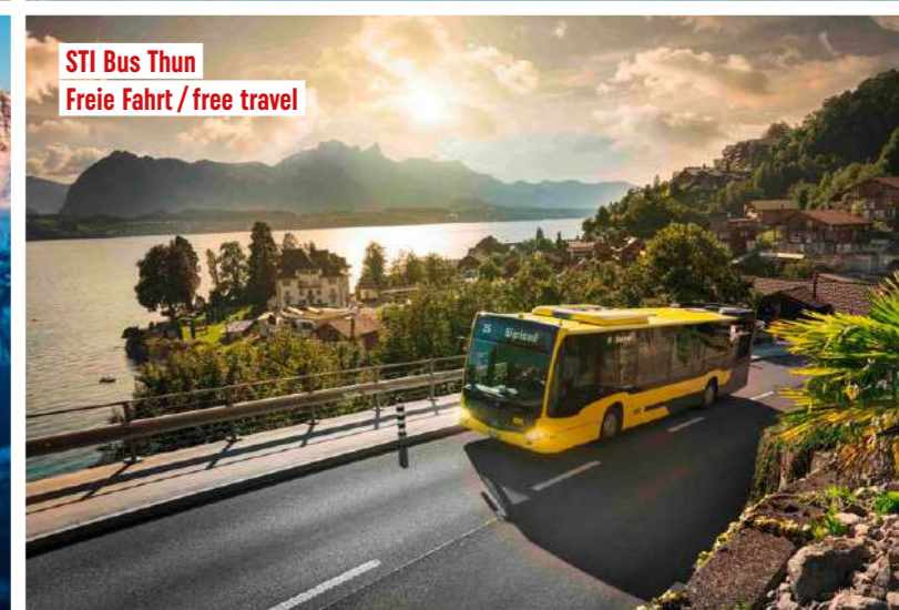
STI Bus Thun Freie Fahrt / free travel