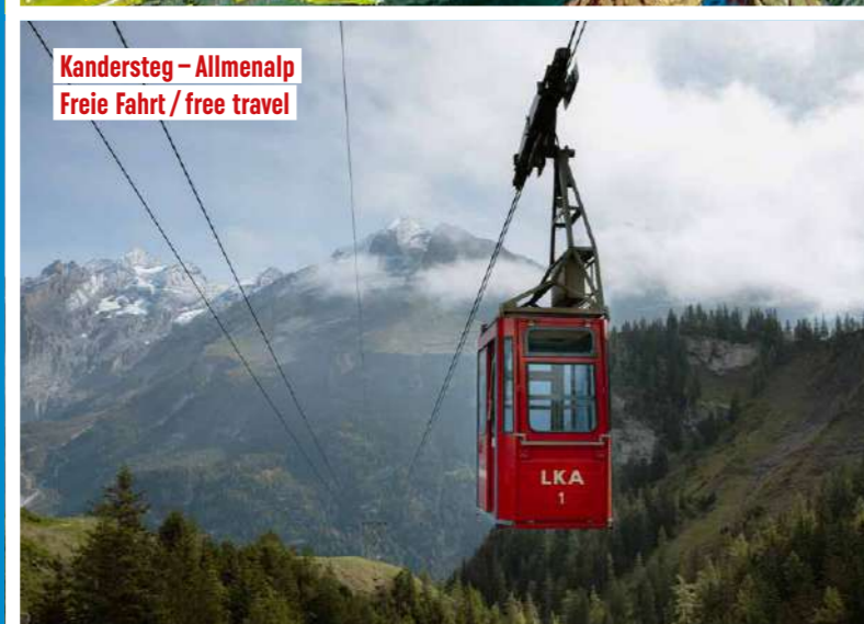
Kandersteg – Allmenalp Freie Fahrt / free travel