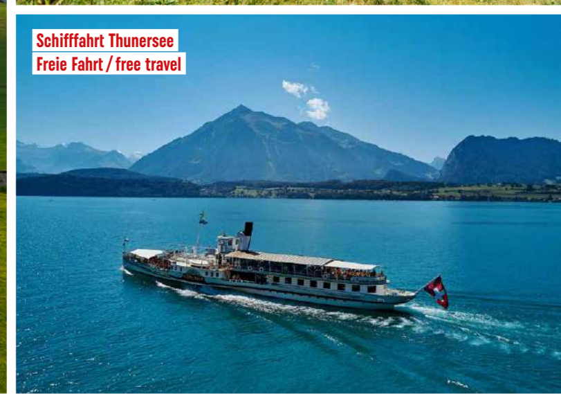
Schiffahrt Thunersee Freie Fahrt / free travel