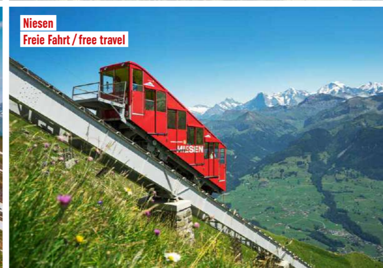
Niesen Freie Fahrt / free travel