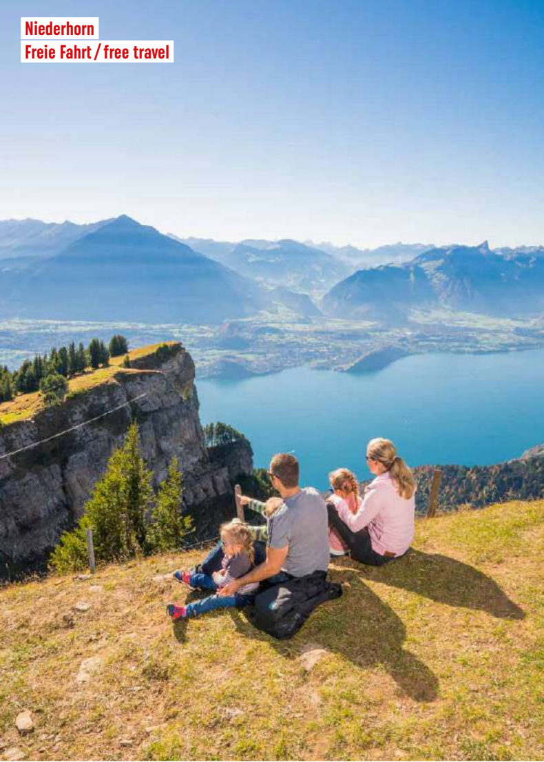
Niederhorn Freie Fahrt / free travel