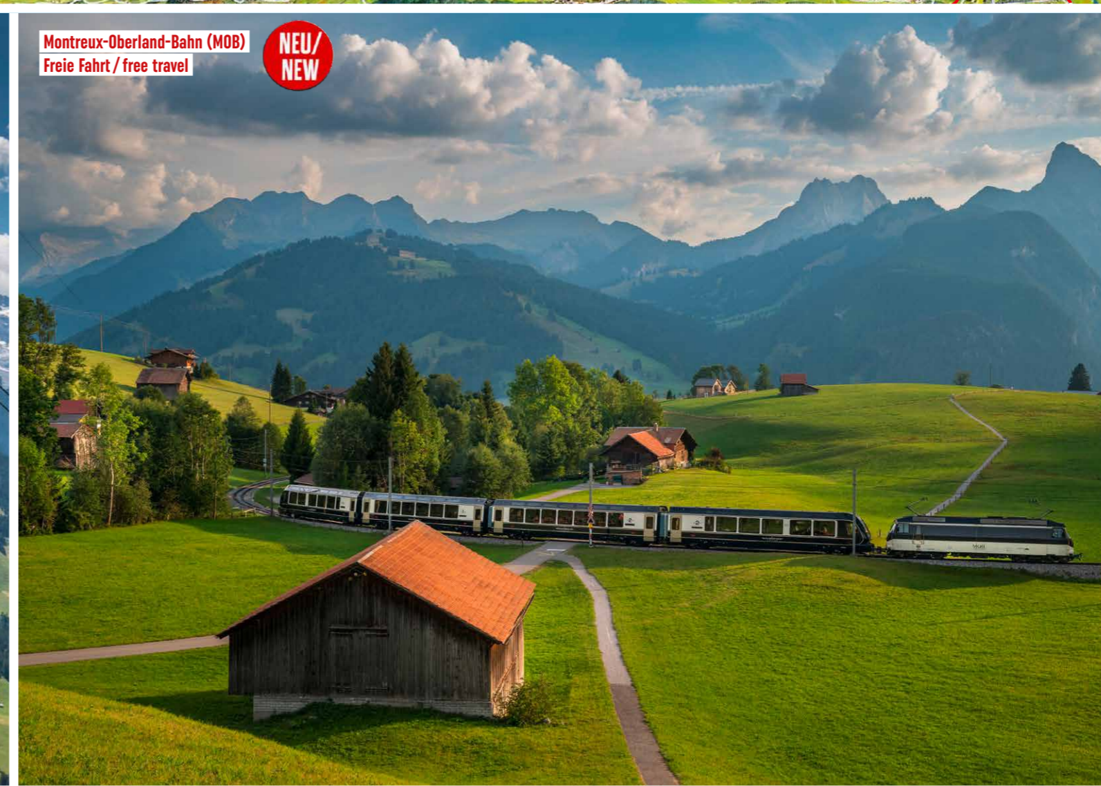
Montreux-Oberland-Bahn (MOB) Freie Fahrt / free travel