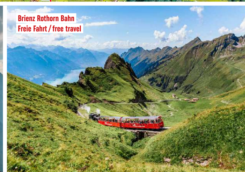
Brienzer Rothorn Bahn Freie Fahrt / free travel