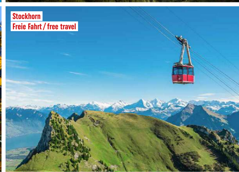
Stockhorn Freie Fahrt / free travel