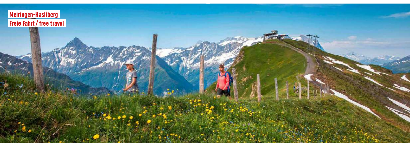
Meiringen-Hasliberg Freie Fahrt / free travel