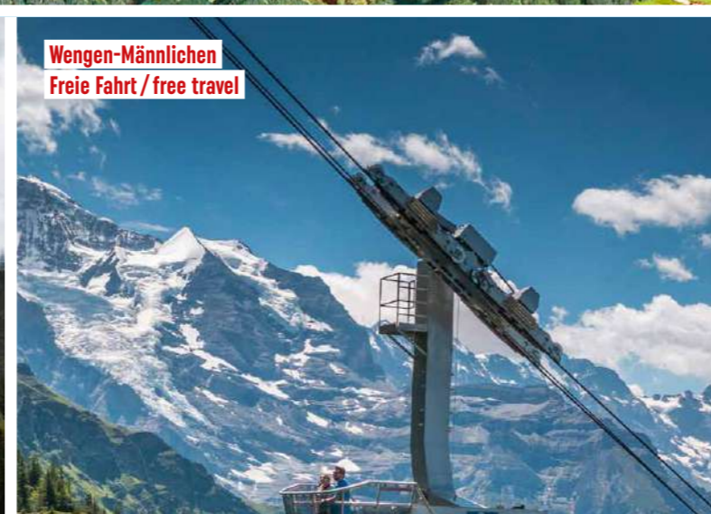
Wengen – Männlichen Freie Fahrt / free travel