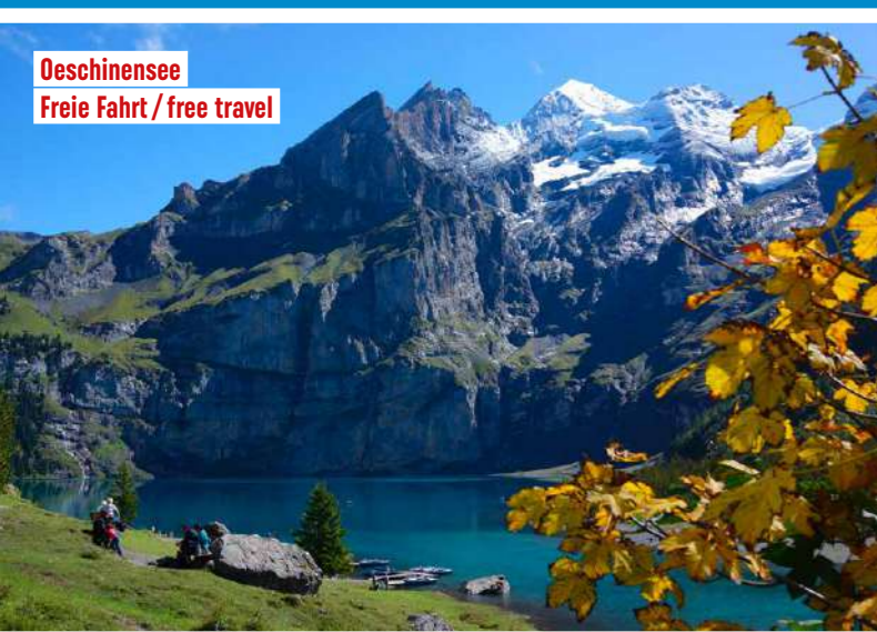
Deschinesee Freie Fahrt / free travel